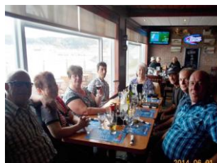
Les joueurs de l'une des tables de Cap-aux-Os profitent de leurs gains de jeu en se payant la traite au restaurant.

LA FADOQ et la FADEQ réunissent dans la grande Ville de Gaspé 7 clubs de whist militaire qui se réunissent toutes les semaines dans des arrondissements différents pour des joutes amicales. Cap-aux-Os possède son club qui est composé de 16 à 20 personnes.