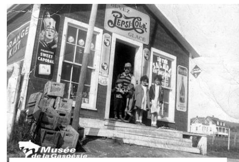
Musée de la Gaspésie Z-420

De la part de toute l'équipe de la Table de concertation de Cap-aux-Os : bon été et bonne récolte aux pêcheurs, agriculteurs, apicultrices et forestiers de la paroisse, de même qu'aux gens de tourisme.